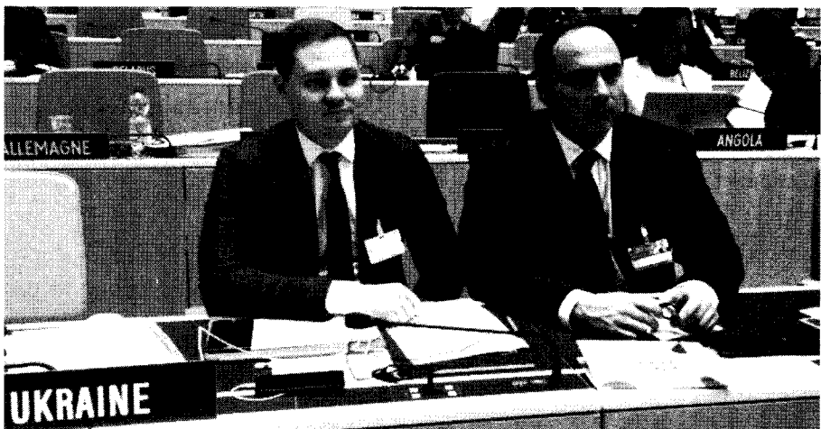
Заступник Міністра економічного розвитку і торгівлі України Михайло Тітарчук та Генеральний директор Державного підприємства «Український інститут інтелектуальної власності» Андрій Кудін

Генеральної Асамблеї, Координаційного комітету та Асамблей держав — учасниць Союзів, адміністративні функції яких виконує організація. Це глобальна платформа для зустрічі фахівців, які відповідають за розвиток сфери інтелектуальної власності на національному рівні; сюди запрошують керівників патентних відомств країн світу, представників профільних міністерств. На сесіях підсумовують результати функціонування ВОІВ за рік, що минув, обговорюють стратегічні напрями її розвитку. Участь делегації України в роботі зазначених органів надає можливість безпосередньо долучитися до регулювання діяльності ВОІВ, успішно відстоювати інтереси держави в галузі інтелектуальної власності на міжнародному рівні, сприяє ефективній реалізації державної політики у зазначеній сфері. Окрім засідань, захід передбачає